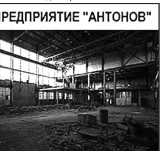
ДО МАЙДАНА ЧЕРЕЗ ГОД ЗАВОД НЕПАТРИОТИЧНО СОТРУДНИЧАЛ С МОСКАЛЯМИ

Заглянули бы в прошлое, в 1940-й год. В прибалтийские республики ввели войска на основании договоров с правительствами. Надо признавать Донецкую республику, заключая с ней такой же договор и обеспечивать безопас-