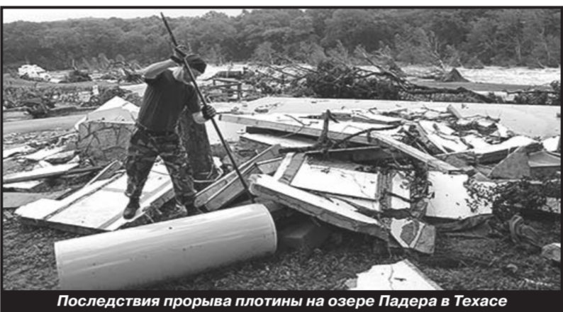
Последствия прорыва плотины на озере Падера в Техасе

«Нехватка инвестиций — серьёзная проблема, и во многом она связана с низкими про-