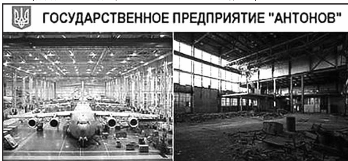
ДО МАЙДАНА ЧЕРЕЗ ГОД ЗАВОД НЕПАТРИОТИЧНО СОТРУДНИЧАЛ С МОСКАЛЯМИ

Не поздно ли готовиться к войне? – Она уже идёт! И к происходящему на Украине надо относиться как к военным операциям. Киев Россия проиграла, а Крым выиграла! Донецко-Луганскую операцию выигрывает, а Одесскую и Харьковскую проигрывает. Не «Новости» смотрим и слушаем по ТВ, а сводки с фронтов! Не уподобиться бы нам англо-американским союзникам времён Второй мировой войны, которые три года ждали, прежде чем высидеться в Нормандии. Они опоздали в Берлин, а нам не опоздать бы в Киев. Если так дело пойдёт, Донецк без нас разберётся с бандеровцами. У него есть все шансы, и я ему желаю этого! Были бы силы, сам взял в руки автомат и поехал туда, где бывал неоднократно.